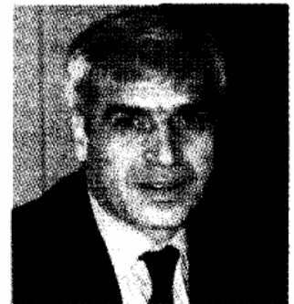
AVVERSARI Nichi Vendola (in alto) e Rocco Palese